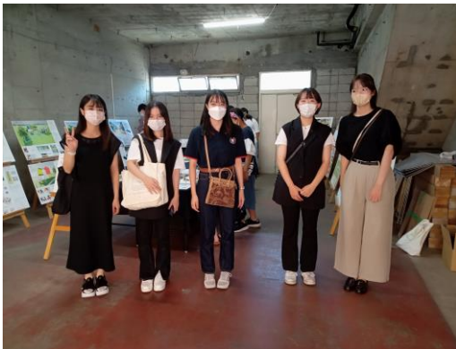
日本大学デザイン学科の皆さん

9月10日（土）、花見川団地の活性化のため、団地商店街において「日本大学デザイン演習課題作品展示会」と「デジタルファブリケーション体験ワークショップ」が、開催されました。