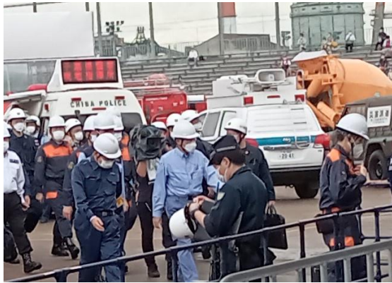
訓練を視察する岸田首相

令和 4 年 9 月 1 日（木）、千葉市蘇我スポーツ公園を会場として、第 43 回九都県市合同防災訓練が行われました。今回は 9 年ぶりに千葉市が中央会場となり、岸田首相も視察に来場されました。訓練は、首都直下でマグニチュード（M）7.3、最大震度 6 強の地震が発生したと想定され、参加した警察や消防、自衛隊などの各機関が連携し、救助活動や情報収集、物資の輸送手順などを確認いたしました。