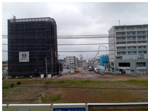
JR 幕張駅から見た駅前の様子

現在、工事が進められている JR 幕張駅北口駅前広場(約 6,400 m 2 )は、令和元年度から、電線共同溝、上下水道、ガス管移設の工事が行われており、令和 4 年度も引き続き工事が行われます。