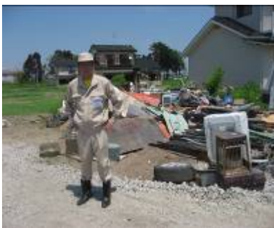
仙台市宮城野区にて

東北3県を中心に、被災地には今後も足を運びボランティア等、何らかのかたちで支援させていただきたいと考えております。