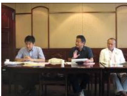
神戸児童センターにて

今回の視察では、浜松市において「地域子育て支援拠点事業」他、神戸市において「防災教育について」「神戸市まとめの達人」「発達障害への取り組みについて」他、浜松市・神戸市それぞれの職員の皆様にお世話になり、お話を聞くことができました。