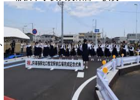
幕張中学校吹奏楽部の演奏

これにより、バス・タクシー・自家用車の乗り入れが可能となり、駅をご利用される皆様の安全確保及び利便性が向上いたします。