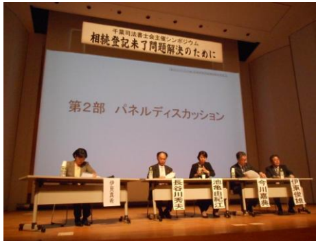
相続登記未了問題研修会

の案内がありました。空家・空地対策の更なる強化を目指し、空家等対策計画策定のための協議会の設置及び空地への立入調査に関する規定を設ける等、平成 25 年 4 月施行の、千葉市空き家等の適正管理に関する条例の一部改正を行うとともに、平成 27 年 5 月に全面施行となった、空家等対策の推進に関する特別措置法の施行に伴い、本条例の規定の整備を行うもので、条例（案）の公表～意見の提出～意見の公表後、パブリックコメント手続きの結果等を踏まえ、第 2 回定例会に条例（案）を提出、8 月 1 日より施行予定です。