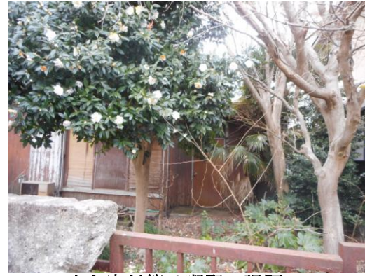
空き家対策は喫緊の課題

そうした中、先日、「千葉市空き家等の適正管理に関する条例の一部改正（案）」のパブリックコメント手続きの実施について