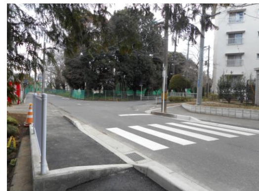
延伸された歩道と横断歩道