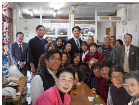
熊谷市長と花見川区の皆様