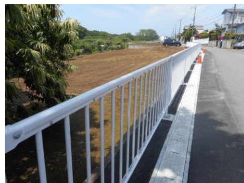
整備された側溝と設置された柵