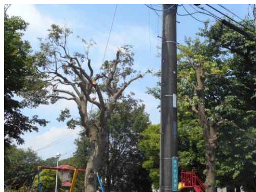
樹木剪定後の横戸台北公園

第40号において、「横戸台北公園の樹木が電線にかかっていると同時に家に陽が当たらない。」とのご連絡をいただいたことをお伝えいたしました。このたび樹木の剪定が行われ、明るさを感じられるようになりました。また、花見川第1小学校・花見川第2小学校統合による新設小学校の通学路整備については度々お伝えしておりますが、柏井町の道路にあった蓋のない側溝が整備されると同時に、転落防止用の柵が設置されました。今後も、新設小学校のみならず、通学路の安全対策については厳しくチェックし、危険が無いように万全を期す所存です。